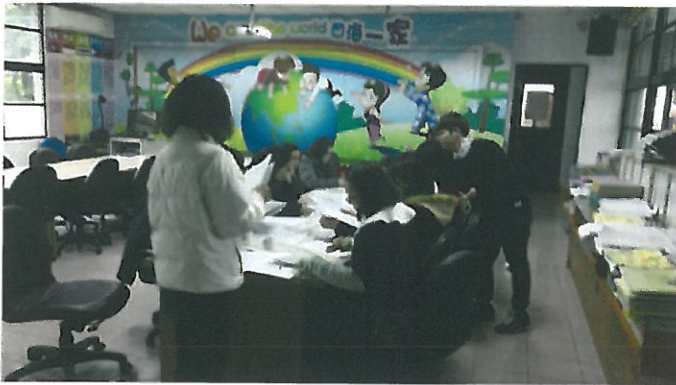
請委員看實施計畫內容