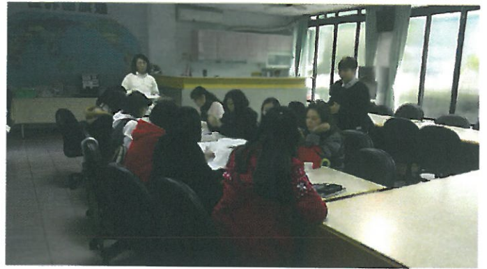
承辦人說明分工及具體作法