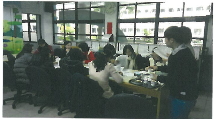
委員發表可行的方向