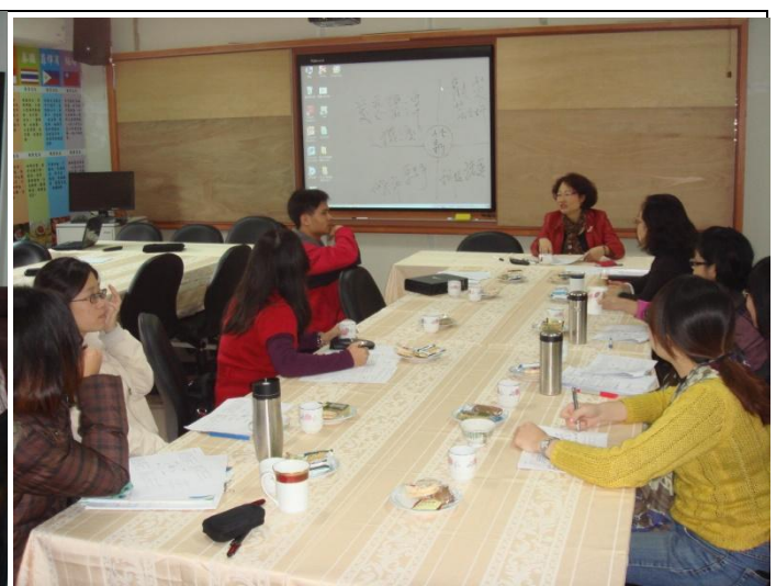
在校長帶領下，各委員發表意見討論